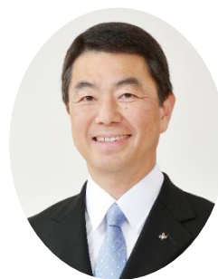
宮城県知事 村井 嘉浩