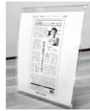
掲示用ボード(サンプル)