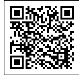
参加申込みフォーム

URL https://www.shinsei.elg-front.jp/miyagi2/uketsuke/form.do?id=1691127468068