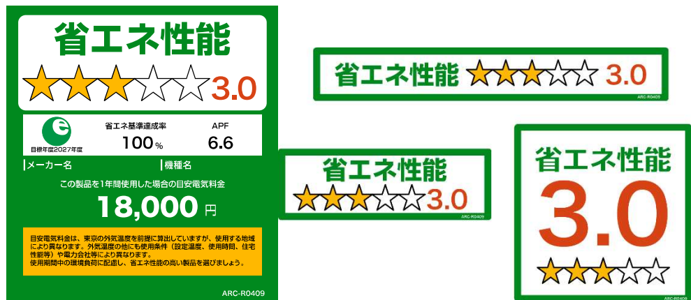
(家庭用エアコンディショナーのイメージ)